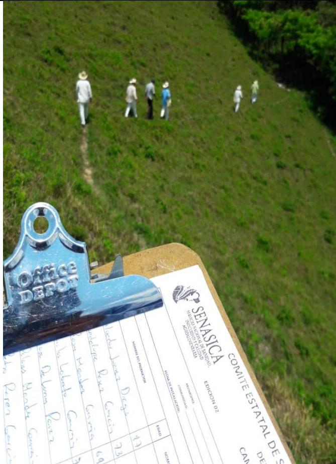
Mapeo recorrido de predios