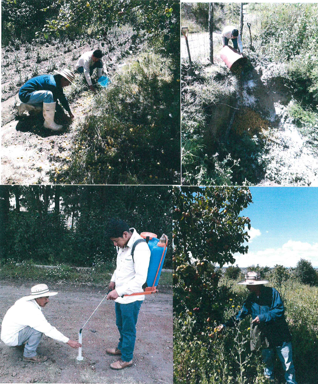
Recolección y destrucción de frutos; calibración de equipos de aspersion; toma de muestras de frutos.

Evidencia fotográfica de las acciones realizadas en la Campaña Nacional contra Moscas de la fruta, durante el mes de septiembre de 2019.