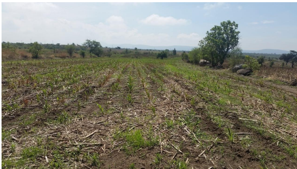
Figura 3. Rebrotos de sorgo