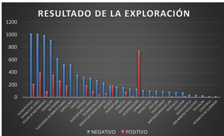
Figura 2. Resultado de la exploración