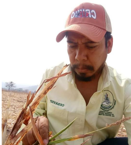
Figura 4. Exploración