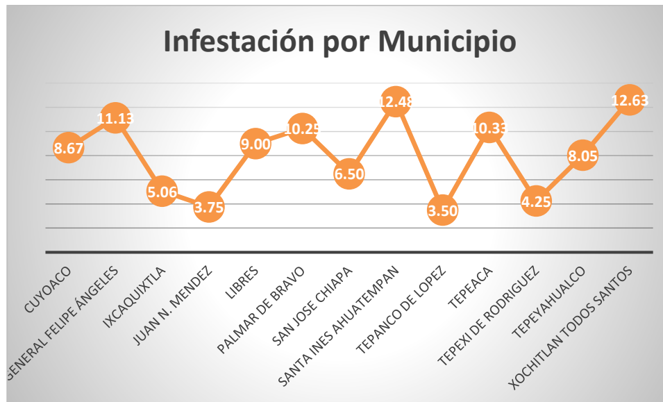
Gráfica 3. % Infestación por municipio, septiembre 2021.

De acuerdo al muestreo realizado en cada predio y las plantas positivas con insectos y/o síntomas causados por Epilachna varivestis , se registra un porcentaje de infestación mensual de 8.4% y por municipio como se muestra en la gráfica 3.