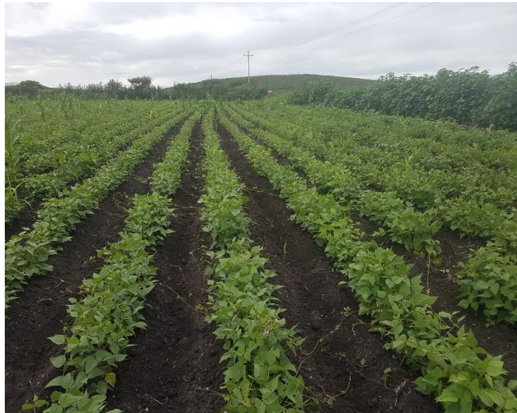
Figura 1. Predio de Frijol

Durante el mes de agosto 2021, se realizó un seguimiento en muestreo de un total de 480 hectáreas con una infestación promedio de 8.17 %.