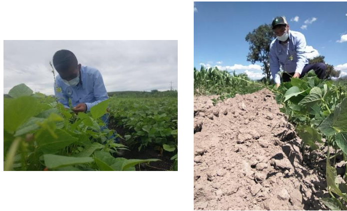
Figura 2. Acción de muestreo de conchuela de frijol ( Epilachna varivestis )