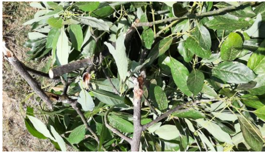
Figura 1 Control de focos de infestación de barrenador de ramas

En el mes de marzo de 2021, personal técnico de la campaña fitosanitaria realizó los muestreos para la detección de barrenadores del hueso (Figura 1) en una superficie de 988.31 hectáreas y en 261.65 hectáreas para barrenador de las ramas. Se llevó a cabo el control de focos de infestación de Barrenador de las ramas en 10 predios, con acciones de aplicación foliar y poda. Así mismo, se realizaron 6 revisiones de 6 trampas tipo ala para palomilla barrenadora, con resultado negativo. En este periodo se realizaron 2 eventos de Capacitación a productores.