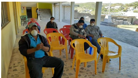
Figura 1 Capacitación a productores

En el mes de abril de 2021, personal técnico de la campaña fitosanitaria realizó los muestreos para la detección de barrenadores del hueso (Figura 1) en una superficie de 959.08 hectáreas y en 129.60 hectáreas para barrenador de las ramas. Se llevó a cabo el control de focos de infestación de Barrenador de las ramas en 23 predios, y para Barrenadores de Hueso en 29 predios con acciones de aplicación Foliar, Censo y Poda. Así mismo, se realizaron 6 revisiones de trampas tipo ala para palomilla barrenadora. En