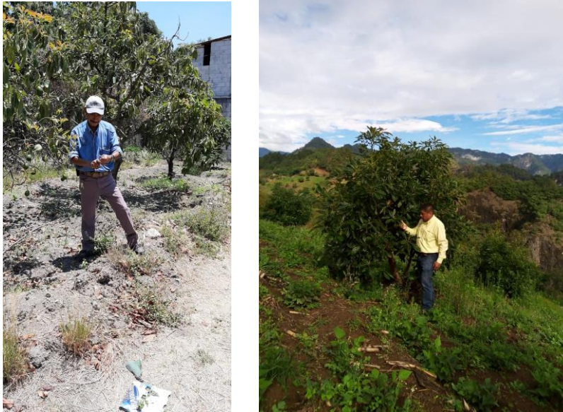
Figura 4. Acción de control focos de infestación de barrenador de ramas en el Municipio de Tianguismanalco.