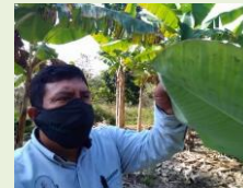
Exploración en área comercial