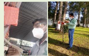
Revisión de trampa