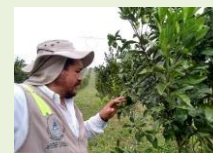
Exploración en área comercial