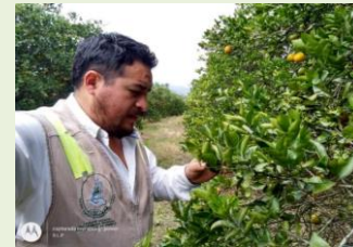
Exploración pasiva en Cítrico