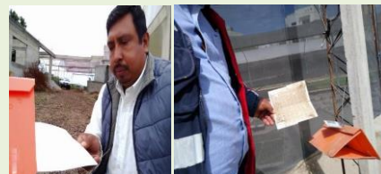
Revisión de trampa