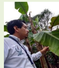
Exploración en área comercial