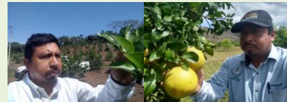
Parcela centinela y Área de exploración