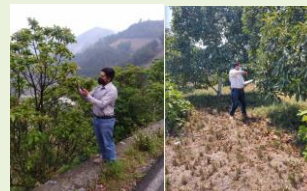
Ruta de vigilancia