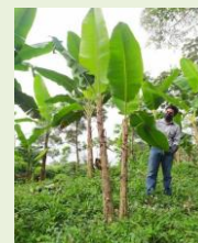
Exploración en área comercial