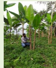
Exploración en área comercial