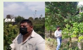
Exploración puntual y Ruta de vigilancia