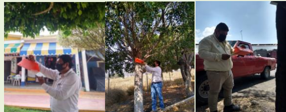
Revisión de Trampa