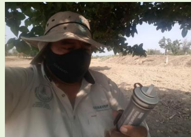
Lectura de Data logger