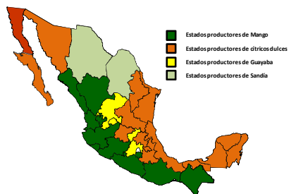
DISTRIBUCIÓN DE HOSPEDANTE DE B. invadens EN MÉXICO

Mango ( Mangifera indica ), Guayaba ( Psidium guajava ), Chirimoya ( Annona Cherimoya ), Guanábana ( Annona muricata ), Toronja ( Citrus paradisis ), Naranja ( Citrus Sinensis ), Sandía ( Citrullus lanatus ), Papaya ( Carica papaya ), Pepino ( Cucumis Sativus ), Kumquat ( Fortunella japonica ), Jitomate ( Lycopersicum esculentum ), platano ( Musa paradisiaca ) y Aguacate ( Persea americana ) entre otros